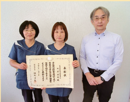
徳島県厚生農業協同組合連合会 阿波病院